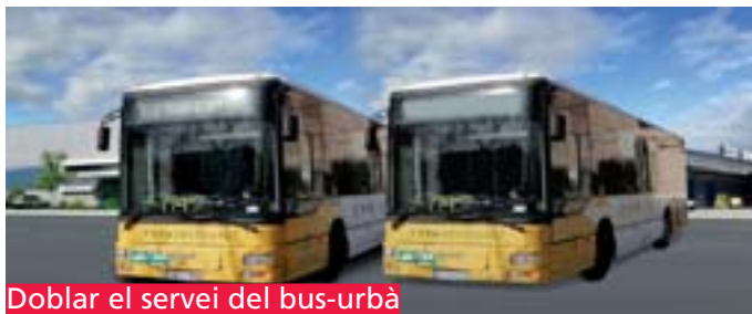
Doblar el servei del bus-urbà