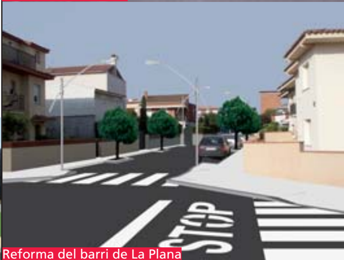
Reforma del barri de La Plana