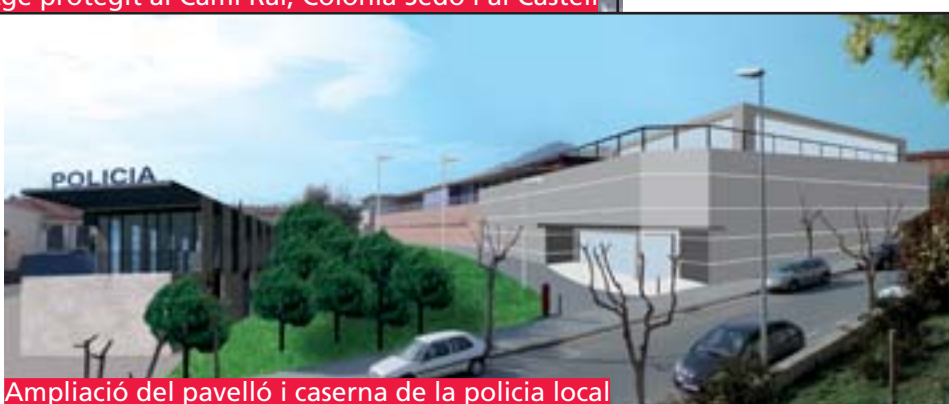
Ampliació del pavelló i caserna de la policia local