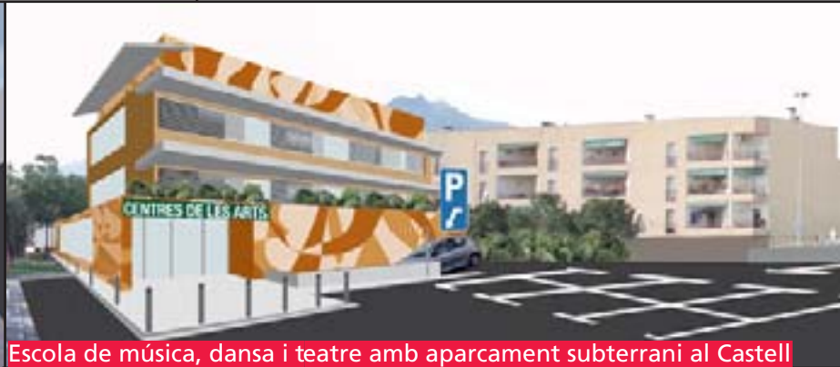
Escola de música, dansa i teatre amb aparcament subterrani al Castell