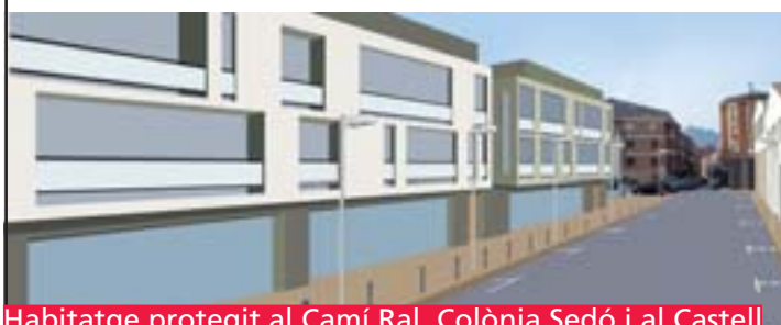
Habitatge protegit al Camí Ral, Colònia Sedó i al Castell