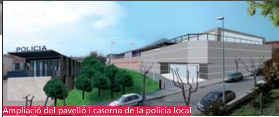
Ampliació del pavelló i caserna de la policia local

⇒ Sensibilitzar les empreses sobre la importància de contractar determinats col·lectius: dones, majors 45 anys, joves i persones amb disminució