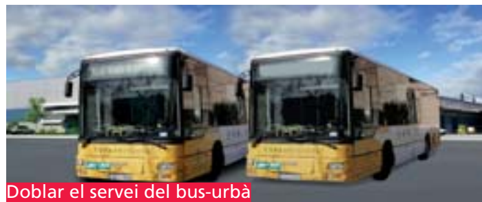
Doblar el servei del bus-urbà