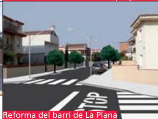
Reforma del barri de La Plana