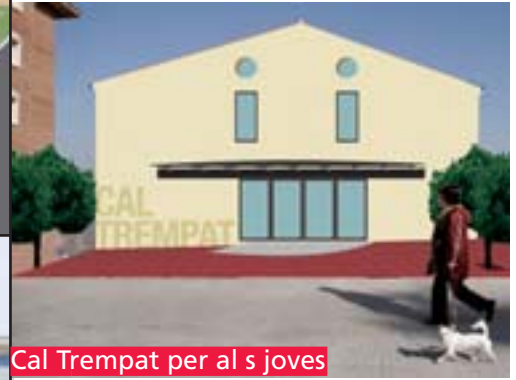
Cal Trempat per al s joves