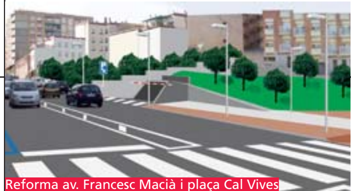
Reforma av. Francesc Macià i plaça Cal Vives