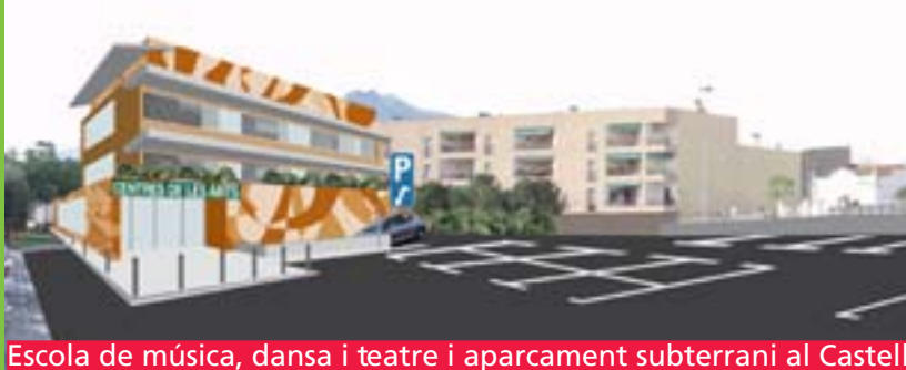
Escola de música, dansa i teatre i aparcament subterrani al Castell