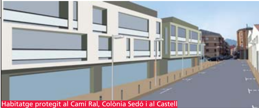
Habitatge protegit al Camí Ral, Colònia Sedó i al Castell