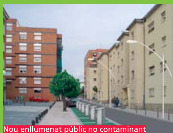
Nou enllumenat públic no contaminant