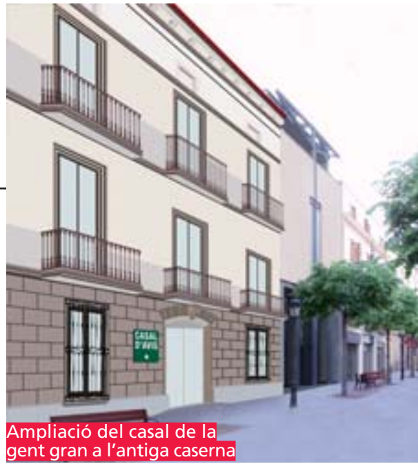
Ampliació del casal de la gent gran a l'antiga caserna