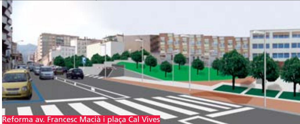
Reforma av. Francesc Macià i plaça Cal Vives