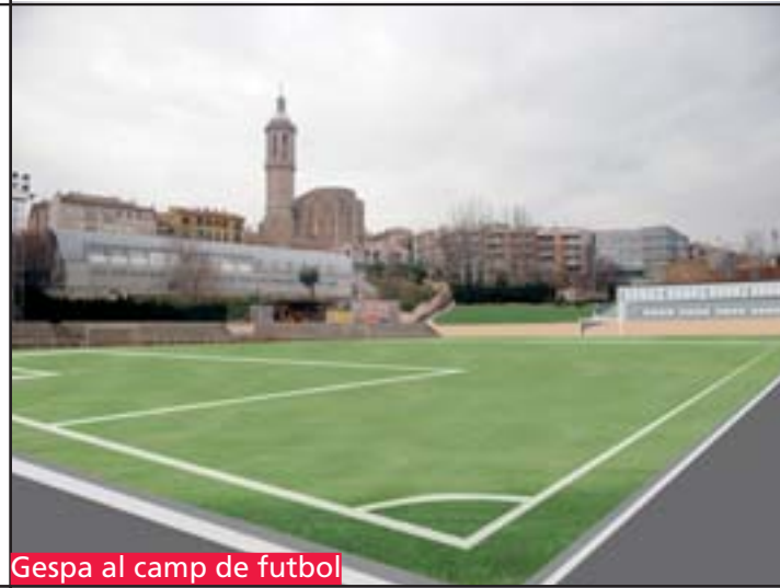
Gespa al camp de futbol