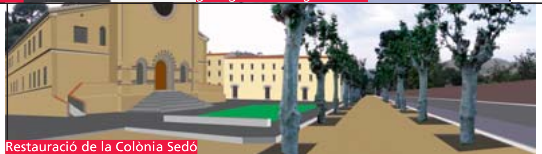
Restauració de la Colònia Sedó