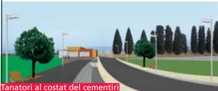
Tanatori al costat del cementiri