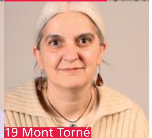
19 Mont Torné