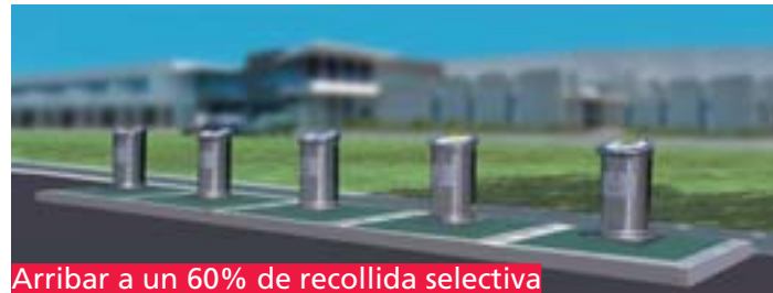
Arribar a un 60% de recollida selectiva