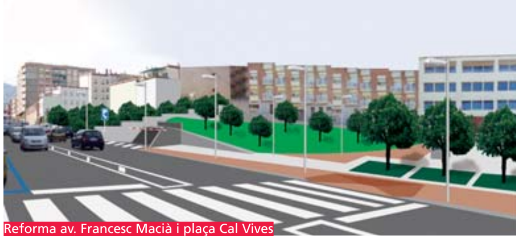
Reforma av. Francesc Macià i plaça Cal Vives