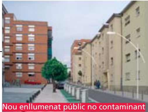
Nou enllumenat públic no contaminant