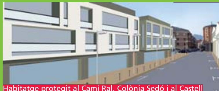
Habitatge protegit al Camí Ral, Colònia Sedó i al Castell