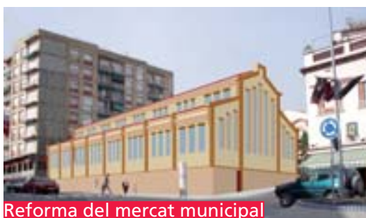
Reforma del mercat municipal

Els dibuixos d'aquest programa són propostes elaborades per l'Entesa, llevat de les imatges virtuals de la biblioteca, la caserna de la policia local, l'autobús urbà i Cal Vives que són extrems de la revista "La vila", penjada a la web municipal.