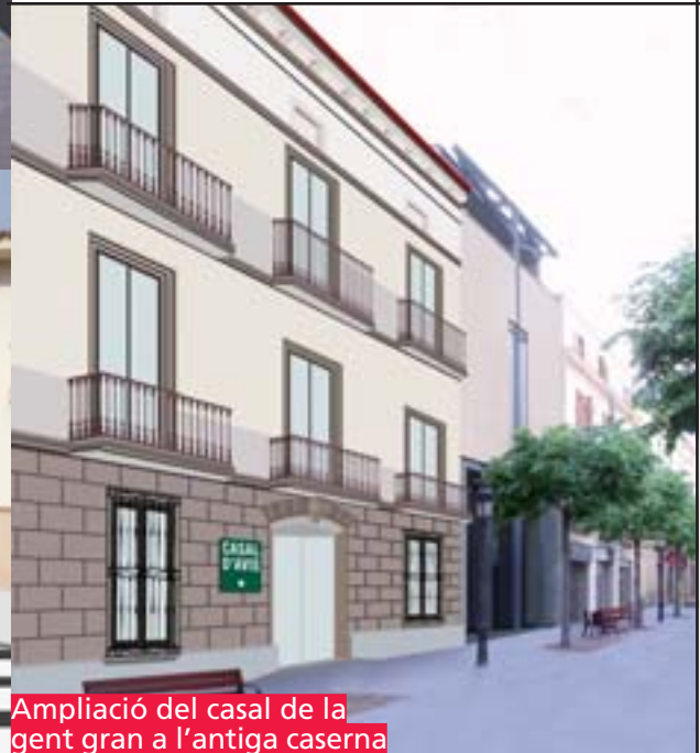
Ampliació del casal de la gent gran a l'antiga caserna