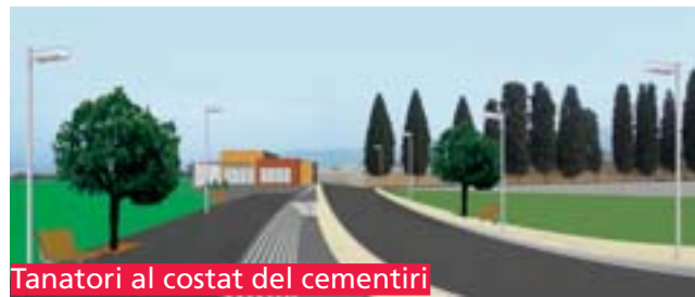
Tanatori al costat del cementiri