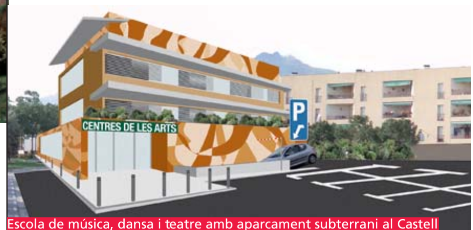
Escola de música, dansa i teatre amb aparcament subterrani al Castell