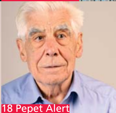
18 Pepet Alert