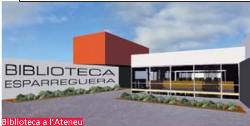
Biblioteca a l'Ateneu