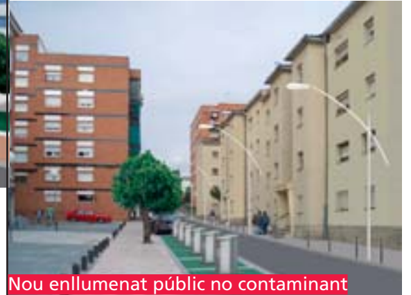
Nou enllumenat públic no contaminant