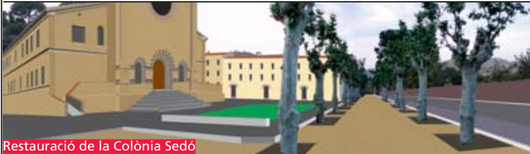
Restauració de la Colònia Sedó