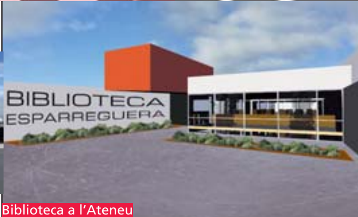
Biblioteca a l'Ateneu