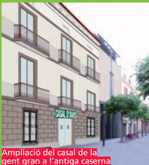
Ampliació del casal de la gent gran a l'antiga caserna