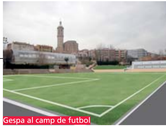
Gespa al camp de futbol